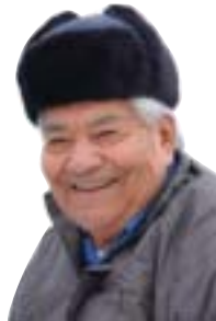
Sourire autochtone

Se désignant comme un peuple nomade de chasseurs – Ndoohéenou –, les Cris se déplaçaient en suivant le cours des saisons et des migrations animales. Parmi le gros gibier, le caribou constituait leur proie favorite. Ils en tiraient non seulement leur nourriture, mais aussi les éléments essentiels à la fabrication des vêtements, des outils, des raquettes, des mocassins et du teepee. Quand au petit gibier, la chasse à l'oie au printemps et à l'automne permettait alors, et encore aujourd'hui, de garnir le garde-manger pour deux mois. Pendant le Goose Break, une des importantes activités ancestrales conservées par les Cris, toute la famille renoue avec la vie de nomade pendant deux semaines.